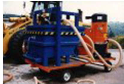
HV-Anlage in Kombination mit Turboventilator zum Filtern schwerer Keramikstäube