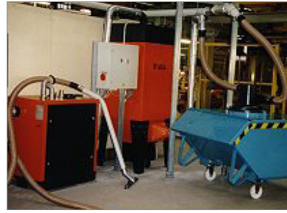
mobile HV-Anlage in Kombination mit HV-Container zum Absaugen von Spänen